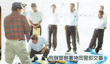
飛騨警察署神岡警部交番