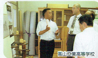
高山工業高等学校