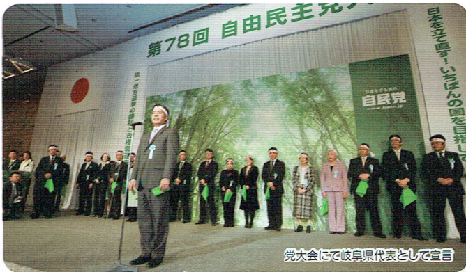
党大会にて岐阜県代表として宣言

各務原市は高度成長期に団地を中心として急激な人口増加をしており、どの団地も急激な高齢化に対応を迫られています。地域として、行政としてできることを早急に考える必要を感じます。