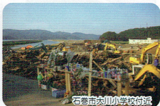
石巻市女川小学校付近