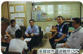
多賀城市 避難所にて

「自分で出来ることは精一杯頑張る」「なくなった人の分まで頑張らなければ」と言われた方々の逞しさに感動しました。