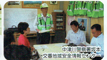
中津川警察署坂本交番地域安全情報センター