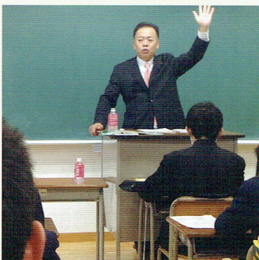
岐阜高校1年生の教室にて

岐阜高校のPSセミナー（Parents To Students Seminar）の講師としてお招きいただき、30分の講演を3クラスでさせていただきました。1年生の生徒に対して「若者の県外流出」という演題でお話させていただきました。結構体力が必要でしたが楽しく有意義な時間になりました。生徒には「岐阜県の人口減少について」「岐阜県の森林率」「福祉の定義」「なぜ勉強するのか、働くのか」という問いかけをしました。また「岐阜県を愛してほしいこと、故郷に誇りを持つこと」「大きな声で話すこと」「たくさん友達を作って高校生活を楽しみ、岐阜高校を好きになること」をそれぞれの学級でお願いしました。