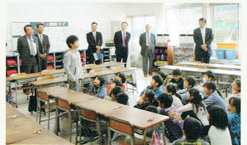
桜小学校の授業視察風景

視察3日目で小学校と秋田県警察本部、国際教養大学を視察しました。秋田市立桜小学校は、生徒数900名程度でキャリア教育がしっかり行われていることと子供達の声が大きかったのが印象的でした。午後から訪問した国際教養大学は、テレビや雑誌で見たことがあり大変興味がありましたが、イメージ通りの大学でした。秋の深まったあまり訪れたことのなかった東北の地で、いろいろな視察ができ地元の味覚を楽しむことができました。