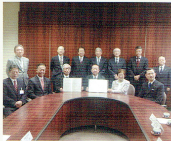
金属団地 組合研修センターにて

岐阜県金属団地協同組合と中部学院大学・短期大学との産学連携に関する協定書の締結式が行われ来賓として参加させていただきました。素晴らしい産学の連携であり、学生のモノづくりに対する意識の向上や岐阜の特色として素晴らしいアイデアが生まれるなど双方ともに良い効果が上がることを期待します。締結式のあとの大学側と組合側の意見交換では、学生と企業の連携の具体的な提案も出たりして大変に有意義な時間でした。午後からは第129回各務原市都市計画審議会が開催されて参加しました。