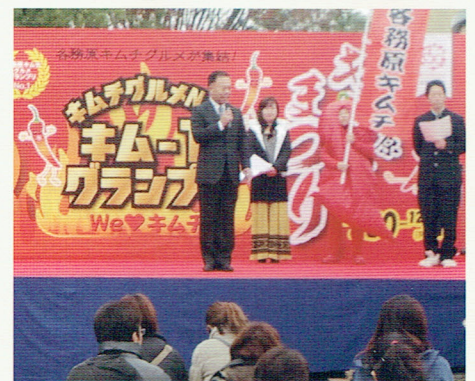
キム-1グランプリ 開会式にて

川島PAにある河川環境楽園において第8回キムチ祭りが開催されており、開会式に参加して激励の挨拶をさせていただきました。今年はB1グランプリならぬキム-1グランプリで、出店している店が約40種類のキムチ料理で来場者からの投票によって競うイベントが行われていました。主催者側としては今日と明日の二日間で4万人の来場者を見込んでいるということであり、ぜひとも目標を達成して大成功して欲しいと思います。各務野高校の生徒さんたちもお店の出店や来場者の勧誘など実践学習で参加しており、高校生たちの活躍している姿が目立ちました。