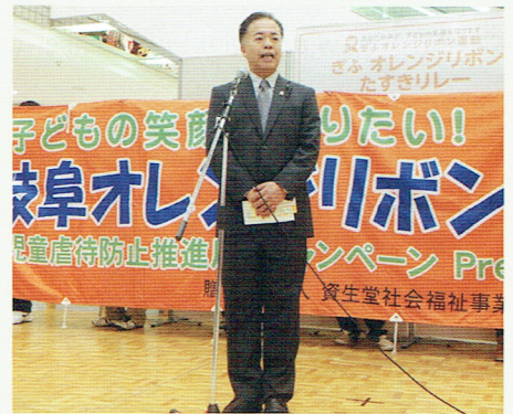
たすきリレーのゴールイベントにて

午前中各務原バドミントン協会主催のミックスダブルス大会の開会式に参加して、協会会長として73組という多くの参加をいただいたお礼とバドミントン普及の願いをしました。午後からはマーサ21で行われた第6回岐阜オレンジリボンたすきリレーのゴールイベントに参加しました。このたすきリレーは「児童虐待」の防止や社会への認識の向上を目的として、岐阜県内3ヶ所からマーサにむけて約300人の方々がたすきリレーをしていくというイベントです。あいにくの天候でしたが、各コースの最終ランナー達が元氣いっぱいゴールし、盛大なゴールイベントが開催されました。