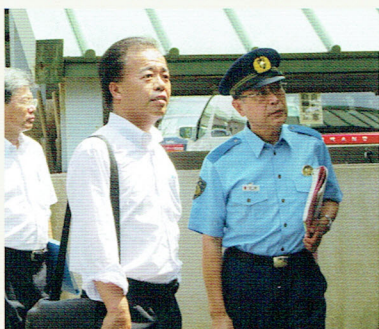
岐阜県警察学校にて

教育警察委員会の県内視察2日目で、白鳥中学校と警察学校、岐阜市の少年センターを視察させていただきました。