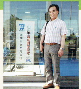
山川地熱発電所玄関にて

枕崎から開聞岳を見ながら指宿へ向かい、途中でJR日本の最南端の西大山駅に立ち寄ってから山川地熱発電所を視察しました。昨年は同じ九州で視察した八丁原地熱発電所に比べて規模が3分の1程度でしたが、発電設備や冷却施設などがコンパクトで解り易い施設でした。再生エネルギーの必要性が高まっていますが、コストパフォーマンスを考えるとなかなか厳しいと感じました。しかしながら安全性や環境問題、資源活用などを考えると地熱発電はもう少し研究と推進されるべきだと思います。