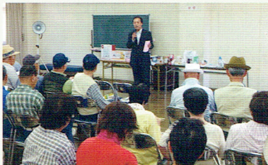
パターゴルフ大会表彰式前の県政報告

例年行っている後援会のパターゴルフ大会と県政報告会を今日と24日の二日間で行います。今日は暑い日でしたが無事一日目を終えることができ、30分近く県政報告もさせていただきました。父の時代の開催当初はこの施設を知っていただくために開催していましたが、整備も行き届いており利用者も年々増加していると思います。当時より参加者の皆さんも腕前を上げておられ、かなりレベルの高い大会になっています。