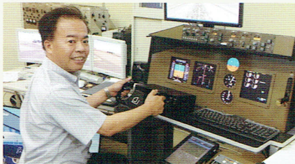
中日本航空専門学校 シミュレーターを体験

先日の海外視察の関連で、中日本航空専門学校を視察させていただきました。私は何度も訪問してはいますが、他の4人の議員は初めてで大変に興味をもたれたようでした。帰り道に十六銀行の頭取が変わったという情報が入り銀行時代の友人に確認してビックリ。議会で指定金融機関の議案が上程されているときであり、何があったんだろうっていう感じです。